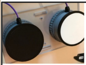
Un capteur par face du bâtiment